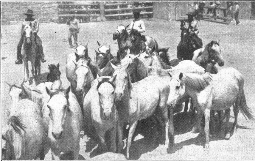
Wildlebende, camargische Pferde während der Segnung durch den Geistlichen.

neuerdings wacker zugriff. Abgesehen davon, hatte er über meine Behandlung nicht zu klagen und genoß als mein Stubengeselle großes Vertrauen, was er mir durch gutmütiges Benehmen, Anhänglichkeit und Treue vergalt. Es war eben ein junges, leicht erziehbares Tierchen, und ich verdankte diesem Gesellen manche köstliche Stunde.