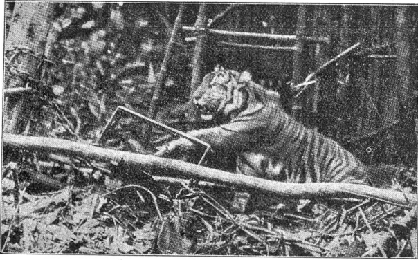
Tiger in der Falle.

gibt und mich hebt... Und da möchte ich fliegen... weit ... weit... bis zur Sonne“ —