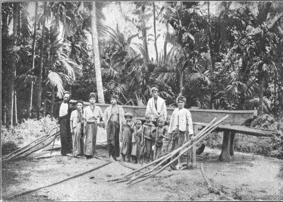
Batakker mit Reisstampfe.

ihren zum Teil noch fernen Wohnungen zu. Sie hatten im Klub des Bezirkshauptortes einige Stunden in fröhlicher Gesellschaft verbracht, Politik getrieben, und das alte Europa neu aufgeteilt. Ich aber glaubte, das Paradies im Morgenland entdeckt zu haben.