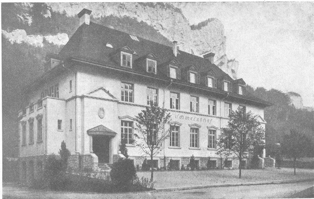
Wohlfahrts-Haus „Schmelzhof“ Klus der L. von Roll'schen Eisenwerke Klus-Balsthal. — Außenansicht.

Pädchen und können beim Fortgehen nur mit einem wortlosen Händedruck danken. — Der nächste Mittag vereinigt um lichterhelle Tafel die Pensionäre des Foners. Auch zu ihnen kommt das liebevolle Christkindgespann. Der dritte Tag ist der große Tag der Weihnachtsfeier. Der große Saal von nahezu 400 Gästen dicht besetzt, vorn die Schulen von Ch., begleitet von den italienischen Lehrbrüdern und den Walliser Lehrschwestern in ihrer kleidsamen Tracht, Mütter und Väter mit den kleinen Ein- bis Dreijährigen auf dem Arm, die Pensionäre als Stammgäste des Foners, Arbeiter, Angestellte, Ingenieure, Chemiker, auch die Direktion der Aluminium-Werke ist