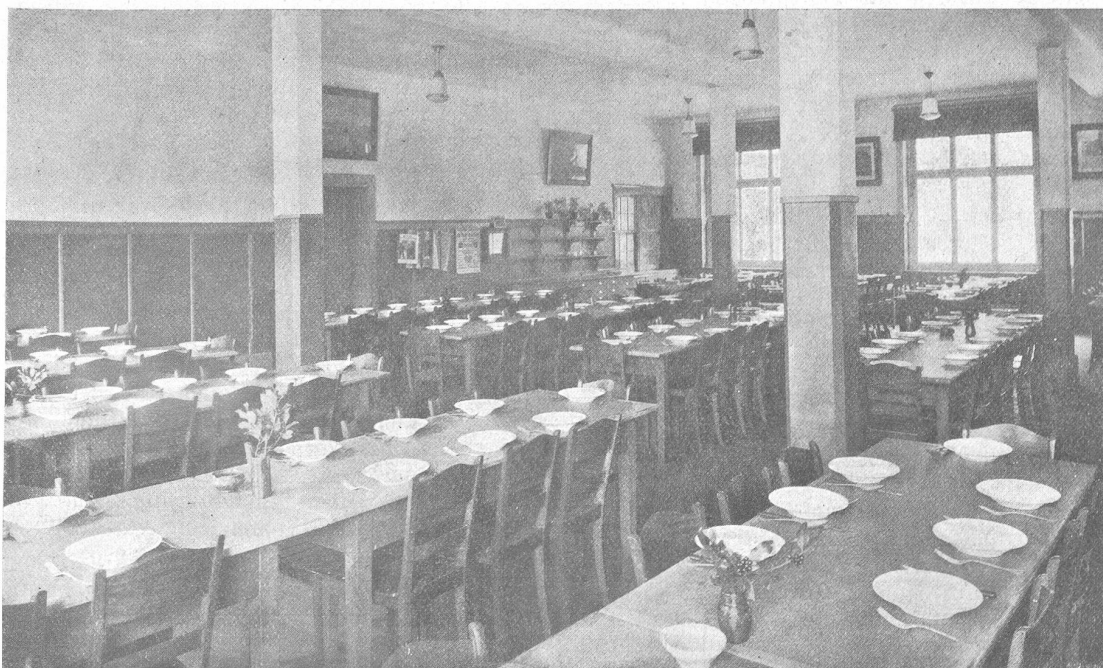
Wohlfahrts-Haus „Schmelzhof“ Klus der L. von Roll'schen Eisenwerke Klus-Balsthal. — Eßsaal.