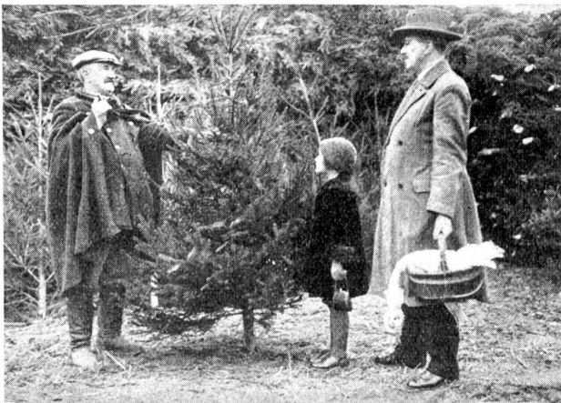
Der Hausvater kauft den Weihnachtsbaum und die unvermeidliche Weihnachtsgans.

Die Mistel ist zwar in der Natur nicht mehr so häufig anzutreffen wie in frühern Jahren. Durch die in unserm Obstbaumgärten sorgfältigere Pflege an den Obstbäumen, das Verlangen des Flurgesetzes beinahe sämtlicher Kantone, dieselbe zu beseitigen oder bei Nichtbefolgung die Verhän- gung einer Strafe, zum mindesten eine Strafandrohung, hat bewirkt, daß man die Misteln weniger mehr vorfindet. Man trifft sie jedoch immer wieder bei aufmerksamer Wan- derung durch Feld und Flur, es ist, als ob sie sich zum Trotz aller Verordnungen doch behaupten wolle. Bei ge- nauerm Zusehen finden wir sie auf alten Ästen fast sämt- licher Laubbäume, ganz besonders auf Apfelbäumen, Edel- kastanien und Schwarzpappeln. Auf den Weißtannen kommt eine Art der Mistel vor, die als Viscum album Abietis bezeichnet wird. Besonders im Winter, wenn die Bäume ihre entblätterten Äste in die Luft hinausrecken, erscheinen die dichten, kugelförmigen Sträucher wie große dunkelgrüne Krähenester im Gezweige. Am meisten erkennen die Leute die Mistel, wenn sie gegen Weihnachten hin in den Schau- fenstern der Läden inmitten buntfarbiger Blumenpracht und im Scheine der glänzenden Kerzen, Perlen und Silberfäden als ein zierliches Sträuchlein von bescheidener Art sein Grüß- chen zum frohen Feste darbringt.