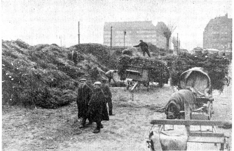
Ankunft der Weihnachtsbäume auf einem Berliner Cadeplatz, von wo aus dieselben den Händlern übergeben werden.

Der Mistel ist schon in der antiken und ebenso in der germanisch-nordischen Mythologie eine besondere Beachtung zu teil geworden und noch heute spielt sie in verschiedenen