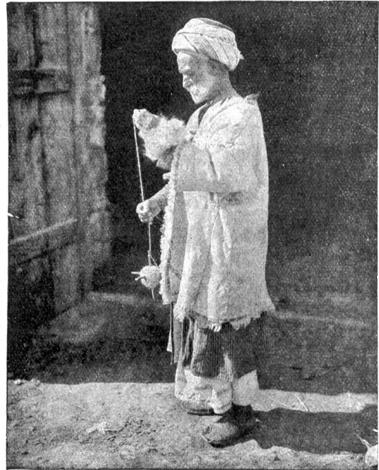
Spinnender Bauer in Palästina.

nach wäre daher Jerusalem wieder eine jüdische Stadt geworden. Das anhaltende Glockengeläute ruft uns jedoch immer wieder ins Gedächtnis, daß man die Stadt nicht