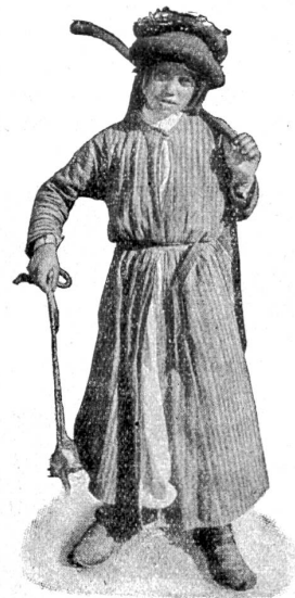
Hirtenknabe mit Stock und Schleuder bewaffnet.

Jedesmal, wenn wir wieder zurückkehrten von unsern Abstechern in die nähere und fernere Umgebung der heiligen Stadt, war es, als kämen wir von einem Besuch beim „Volk des Buches“, wie die Araber die Juden nennen, denen dieses Buch, das heißt die Bibel, zu verdanken ist. So lieblich hebräische Melodien schon in der Wiege (sie stand im Haus der alten Synagoge meiner Vaterstadt) an mein Ohr klangen, so groß mein Verständnis für israelitische Gebräuche, wie z. B. für den am Fest der ungesäuerten Brote aus freundlicher Hand empfangenen Osterfuchen (Mazzen) damals war, so glaube ich doch, die Geschichten der Bibel niemals lebendiger begriffen zu haben, als hier im biblischen Lande. Segen und Fluch, von denen die Geschichte des jüdischen Volkes so voll ist, wie deutlich und dicht nebeneinander treten sie einem hier doch immer wieder entgegen. So heiter und hell der gütige Himmel auch heute wieder auf die Fluren hernieder lachte, so wohlthuend bei Vorgängen der Landarbeit, beim Säen und Pflügen**), beim Anblick spinnender Bauern, oder heimwärts-