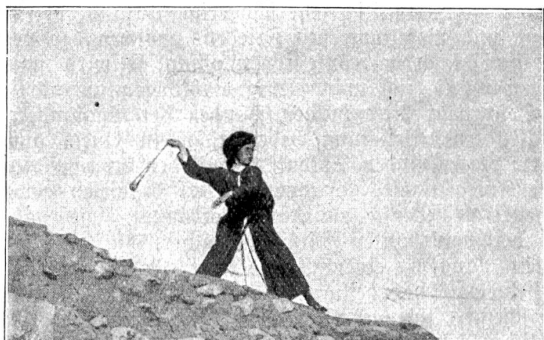
Hirtenknabe, der sich wie der junge David vor 3000 Jahren im Steinschleudern übt.

Die Bevölkerung von Jerusalem besteht zurzeit schätzungsweise aus höchstens 15,000 Moslems, etwa 20,000