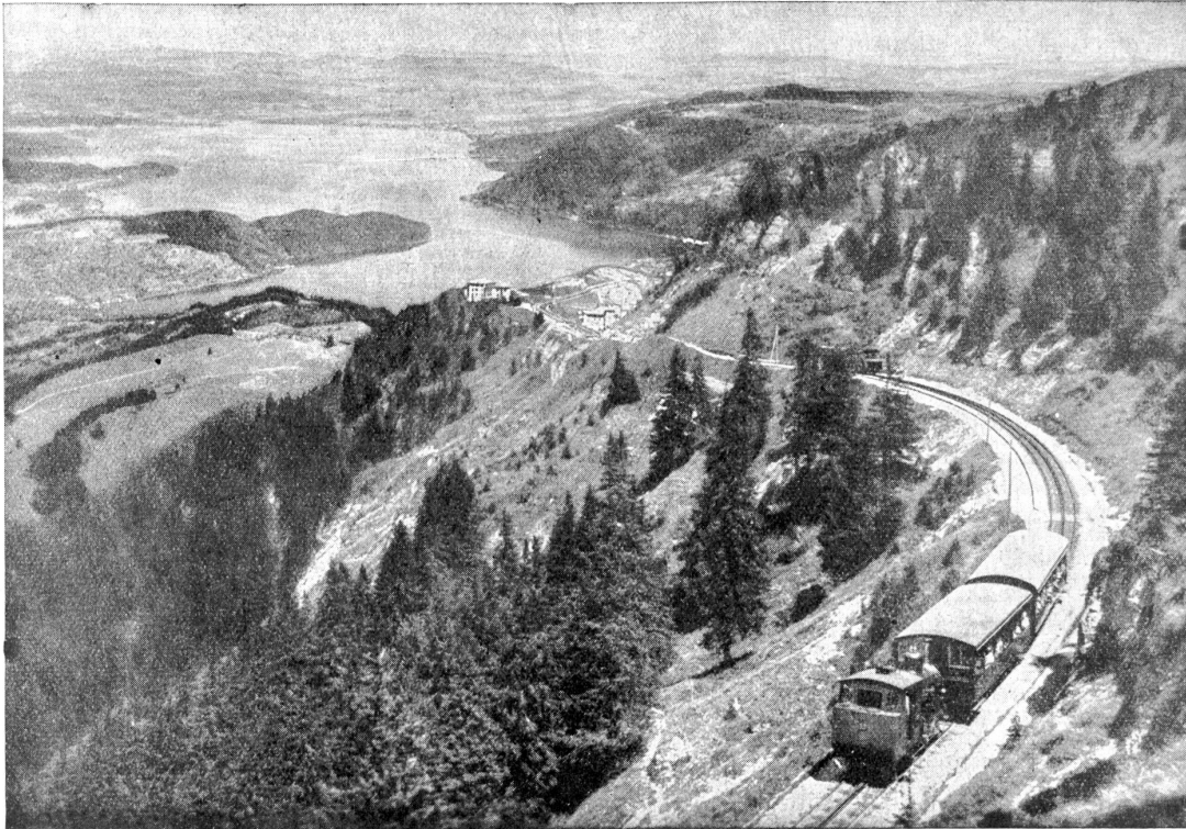
Die Vignau-Rigiabahn zwischen Staffelhöhe und Staffel mit Blick auf den Zugersee.