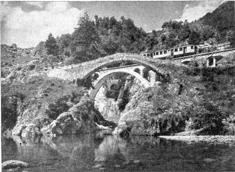
Abb. 1. Brücken im Centovalli, Tessin. Vorn eine alte Steinbrücke mit beidseitig ansteigender Sahrbahn; hinten die neue Eisenbahnbrücke mit Betongewölbe und Aufbauten mit Mauerwerkverkleidung.