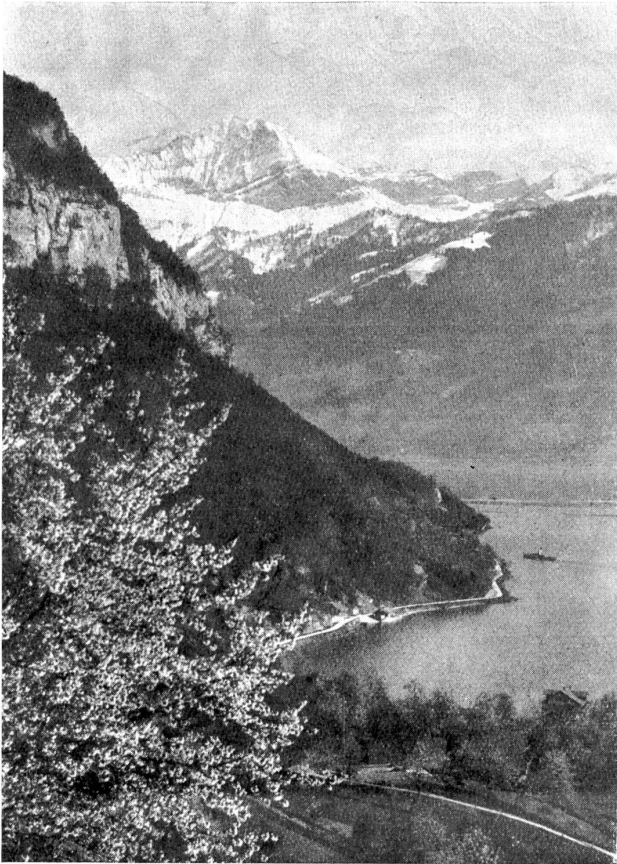
Blick von Merligen auf die Berner Alpen.

„Auch studieren?“ fragte der Staatsanwalt.