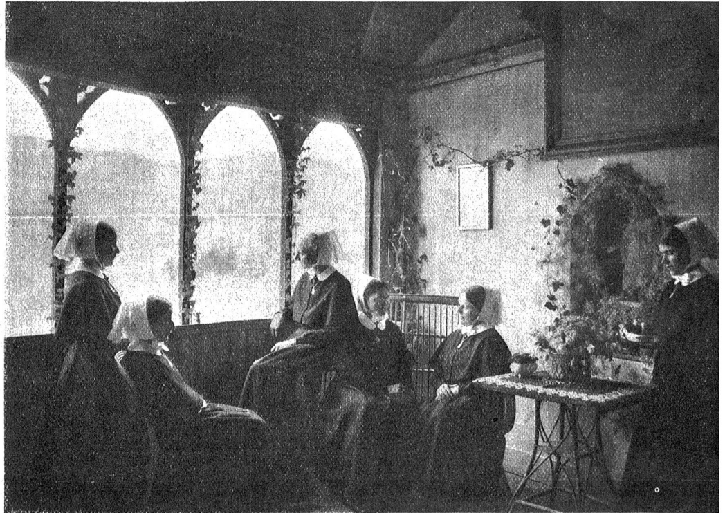
Schloß Wildenstein. Das sogenannte „Wildkirchli“.

Auch für kürzeren Gästebesuch ist das Schloß eingerichtet. Für ferienbedürftige Schwestern stehen Betten zur Verfügung. Sogar ganze Konferenzen fanden schon gastliche Aufnahme im „neuen“ Wildenstein. Zur Stunde hat sich ein kleiner Haushaltungskurs für junge Töchter auf dem Schlosse eingenistet.