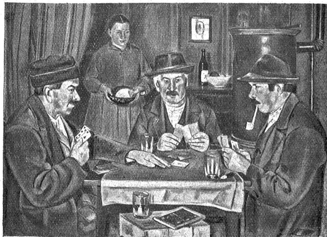
Weihnachtsausstellung bernischer Künstler. — A. Vissan: Kartenpieler. (Klischee aus dem Ausstellungskatalog.)

Heilands Finger legten sich schlank und weich, daß man es fühlte, auf das Haar der Kinder. Die Hände aber der umstehenden Männer krümmten sich wie Vogelkrallen, und ihre Lippen spotteten, als ob sie sagen wollten: „Wie kann