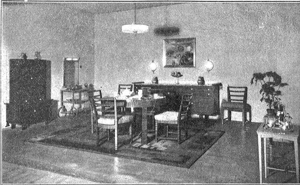
Die Elektrizität an der „Saffa“: Bürgerliches Eßzimmer. Möbelfabrik Meer & Cie., Suttwil.