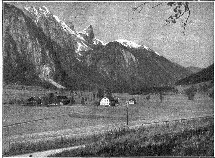
Reutigmoos. — Schwefelwald und Corfmoos hinten rechts. Vorn links die „Sarab“ mit Sägerei, früher Bleiche.

Waadst. Am 1. ds. feierte in voller geistiger Frische der große schweizerische Gelehrte August Forel in Yverne seinen 80. Geburtstag. Er genießt als Pnchi-