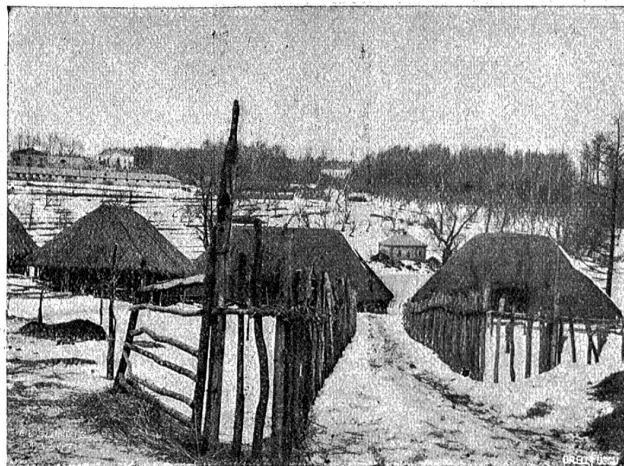
Herrenhaus und Wirtschaftsgebäude in Jassnaja Poljana.

hinter den großen und größten Werken der Weltliteratur, „Krieg und Frieden“, „Anna Karenina“, „Die Auferstehung“, „Die Kreutzerfonate“. Hier erörterte Tolstoi jene schweren Probleme, denen man so gerne aus dem Wege geht. Sie