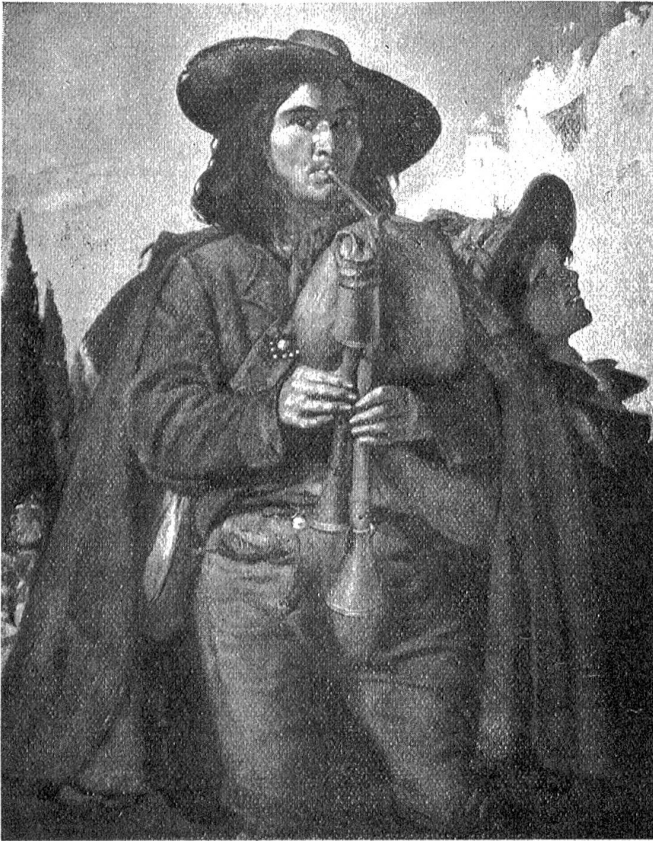
Frank Buchser-Ausstellung in der Kunsthalle Bern: „Pifferari“.