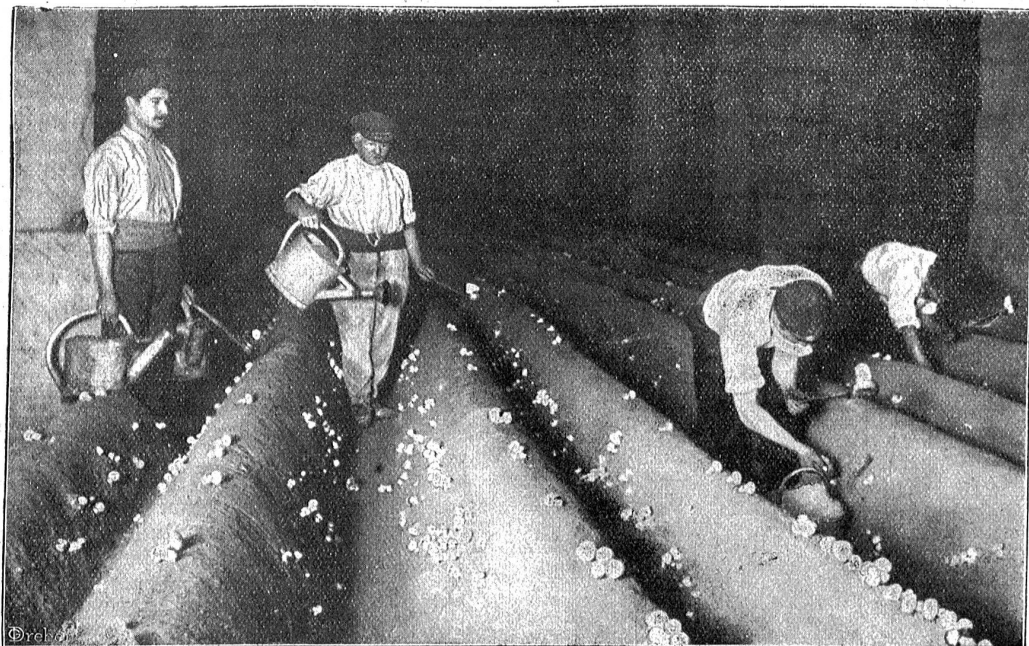
Begießen der jungen Champignons.

der Mistbeete für die Pilzbrut. Auch im Tale der Dife und in den Vororten von Creil sind in neuerer Zeit Züchtereien entstanden. Dem hier vorüberfahrenden Reisenden