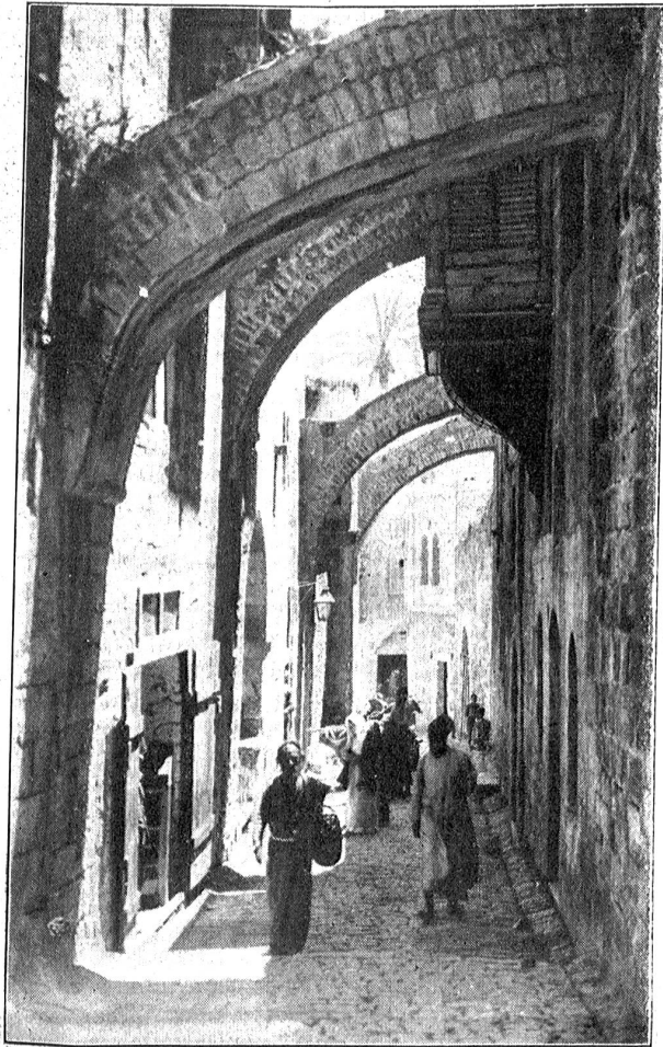
Die „Carik el alam“ (Schmerzensgasse)

eines der ältesten Gäßchen Jerusalems. Rechts im hintergrund sieht man deutlich einen großen viereckigen Stein, der eine kleine Vertiefung hat: von der hand des ermatteten Christus herrührend, sagt das Volk. hier wurde Simon genötigt, das Kreuz tragen zu helfen.