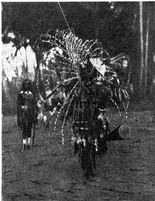
Bei den Papuas. Der Wellen- oder Meer-Dema.

Man erwartet, der Ausdruck bezeichne irgend einen Papuastamm, der im Herzen dieser noch wenig durchforschten Insel, ehemaligem deutschem, heutigem holländischem und englischem Kolonialbesitz, sein Menschenfresserdasein friste. Aber dem ist nicht so. „Knall-Menschen“ bedeutet die Weißen. Der Ausdruck ist von den Ureinwohnern für sie gefunden worden, die mit ihren Knallscheitern den Urwald unruhig machen, die Wilden erschrecken und auf weite Entfernungen vom Leben zum Tode befördern, die Bestände an Paradiesvögeln und anderem Getiere ausrotten, um Federn und Bälge gegen Dollars und anderes wertvolles Geld umzutauschen, Steuern in Form von Kokosnüssen abfordern und mit Gewalt erzwingen, „unsittlich“ nachgehende