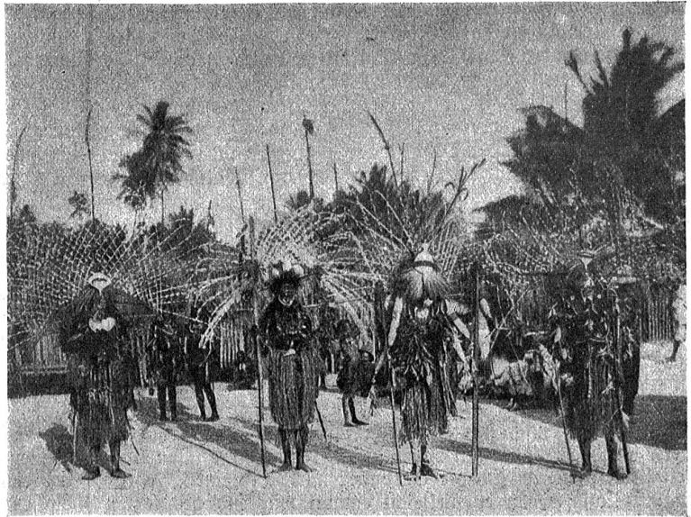
Bei den Papuas Einige Dema-Siguranten.

Am Meraukefluß, unweit der Frederik-Hendrik-Insel im Süden holländisch Neuguineas, liegt die Station Merauke. Von diesem Zentrum aus unternahm Wirz seine oft sehr gefährlichen und beschwerlichen Fahrten zu Wasser und zu Lande in die papuanischen Dörfer, von den ansässigen Weißen meist schmählich im Stiche gelassen, weil