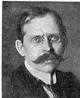
† Prof. Dr. A. de Quervain,