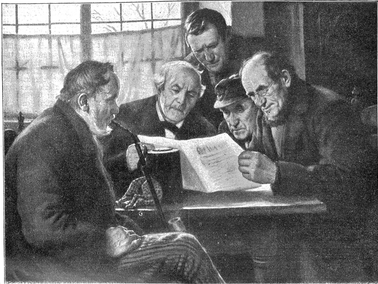
Zeitungsleser. Nach einem Gemälde von Franz Hecker.

Wenn sie auf dem Felde hastete, nahmen Schelten und Ungeduld nur noch zu, und beim Säen des Kohlplazes und des Flachsäckerleins tat sie, als ob auf dem Obermoos nicht ein einziges Kraut gediehe, wenn es auf Glanzmanns Familie ankäme.