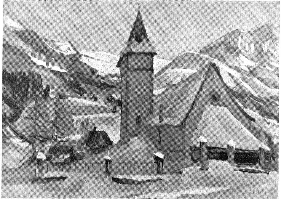
Pro Juventute-Karten 1927 von Kunstmaler Ernst Hodel. Bergkirchlein im Saanenlande.