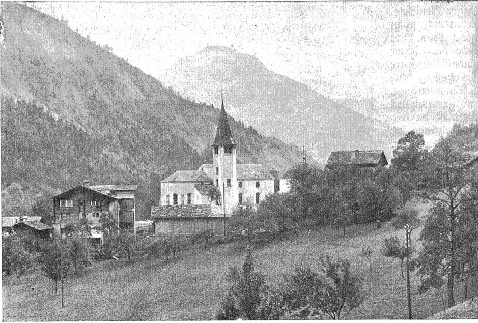
Mörel im Oberwallis. Mörel, ein hübsches Dorf an der Surkabahn-Linie gelegen, besitzt eine schöne Kirche mit einem Beinhaus. Der Kirchturm ähnelt unserm Berner-Styl.

Uhr, Kompaß und Pistole lagen regelmäßig und jederzeit greifbar vor mir. Ich ergötzte mich oft an dem Stilleben, wenn der Sekundenzeiger seine eilige Runde machte, tickend und tuckend, und wenn die Kompaßnadel nervös hin- und herschwankte, bis sie den Ausgleich zwischen dem ablenkenden Pistolenmetall und der Polar kraft gefunden hatte und ruhig nach Norden wies.