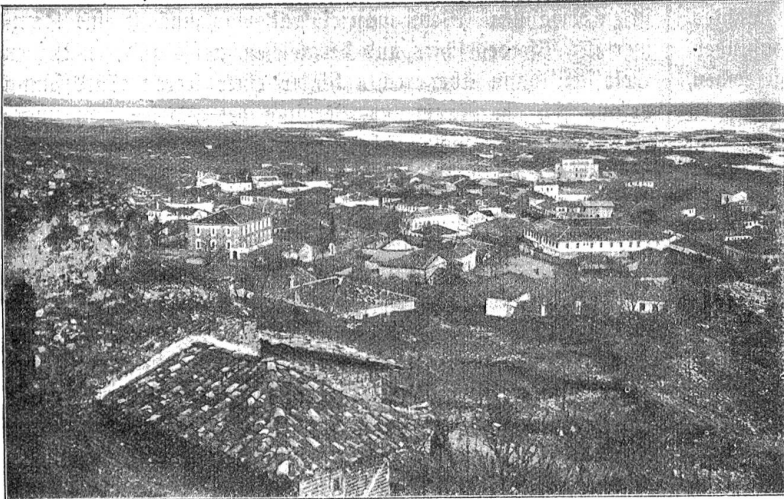
Albanien. Totalansicht der Hauptstadt Durazzo.