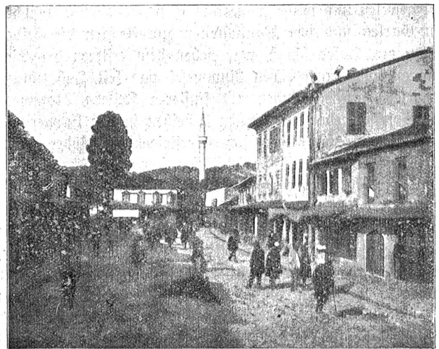
Albanien. Großer Marktplatz in Walona (oben rechts Störche).

Die Abgeschlossenheit und Verkehrsfeindlichkeit des Landes bedingt die Mannigfaltigkeit der Trachten, der Sitten und Gebräuche, der Dialekte und der religiösen Bekenntnisse. Die Albanesen (ihrer eine große Zahl lebt im benachbarten Griechenland und in Süditalien und Sizilien) sind keine ge-