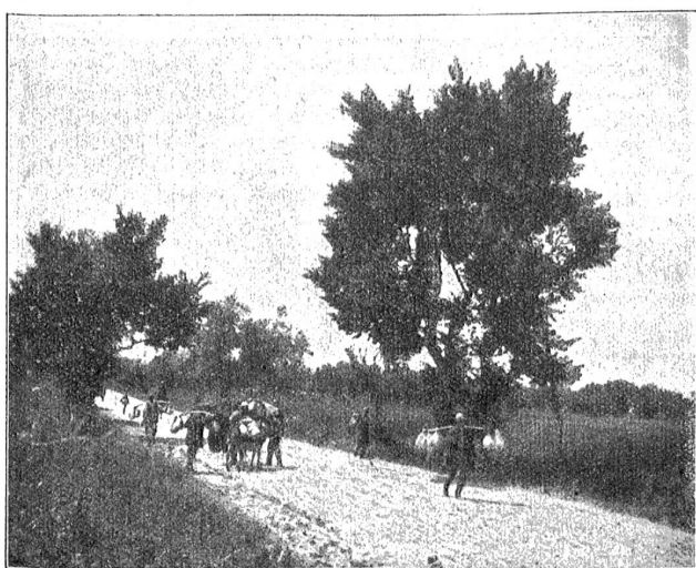
Albanien. Marktbesucher auf der Landstraße Walona-Skala.

Kein edel denkender Mensch wird es sich einfallen lassen, dem Völkerbund entgegenzuarbeiten, solange er der Kriegsverhinderung dient. Jeder Mensch von sauberer Gefinnungsart wird dieser Aufgabe freudig zustimmen. Und jeder sieht ein, daß diese Aufgabe ein paar gute Köpfe und Hände erfordert.