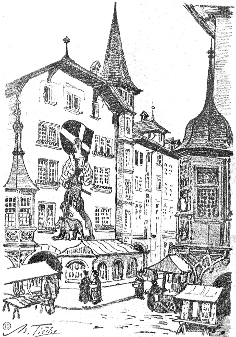
Bern. Die Erkerhäuser am Zeitglocken. Bleistiftzeichnung aus der Mappe von A. Cléche. Verlag Kaiser & Co.

„Laß mich jetzt wieder machen, Franz“, bittet Peter dringlich und zupft den Nachbar am Kermel. „Dummes Zeug“, entgegnet dieser, „meinst nur —, pah —, jetzt schaff'