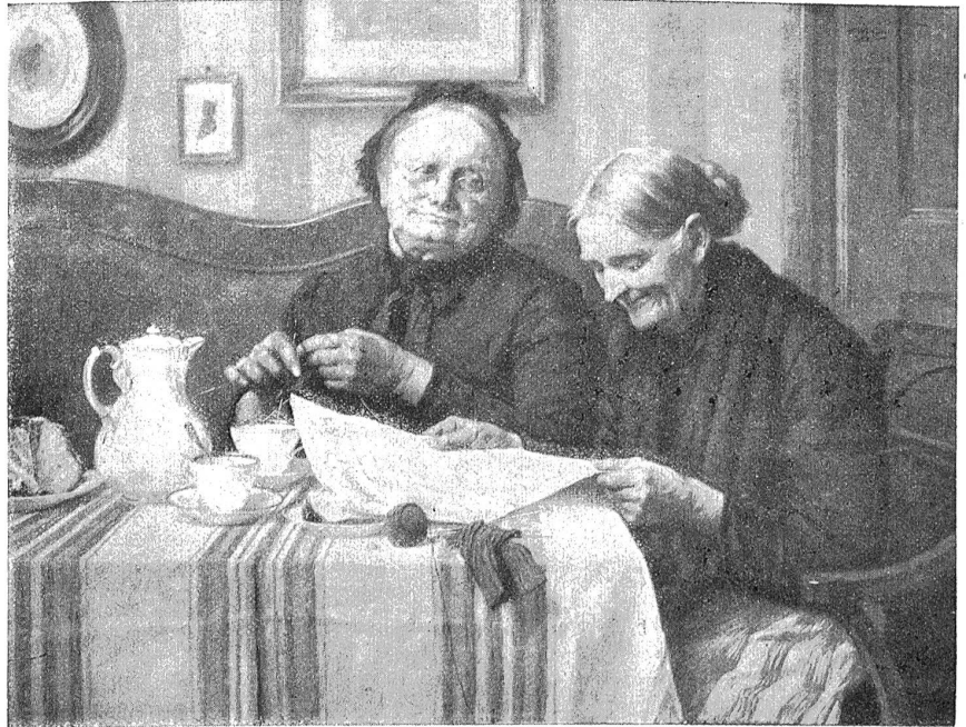
Kaffeestunde. — Gemälde von Walter Witting.

Glanzmann sah sich hilflos im Saale um und rief laut: „Um Gottes und Christi willen! Ich beschwor die