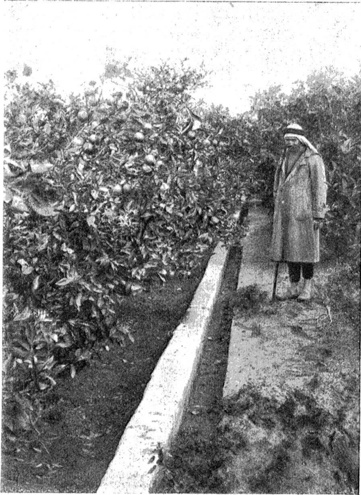
Orangerie mit reifen Orangen.

einem Photographen. Wir liebten uns. Er wohnte bei meiner Mutter und wurde auf den Tod krank. Ich kann wohl sagen, daß ich ihn mit meiner Pflege dem Tode ab-