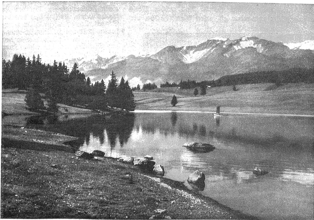
Monbrax bei Montana.

Marianne hustete, durch die Bäume ging ein leiser Windstoß, der Rasen legte sich in grüner Glätte seitwärts.