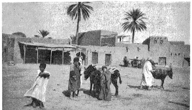
Der Marktplatz in Sidi Okba bei Biskra.

Den selben Abend hätte ich beinahe einen jungen Schakal für 7 Franken gekauft, doch machte man mich aufmerksam, daß sich diese Tiere schwer ans Haus gewöhnen und ganze Nächte durch heulen, sodaß ich auf den Kauf verzichtete und an dessen Stelle mir 2 Dolche erwarb, deren einer mir erst zu 12 Franken offeriert wurde, jedoch zuletzt beide zusammen für 4 französische Franken überlassen wurden. In einem arabischen Café mit 5 Franken Eintritt beschlossen wir bei gutem Mokka und langweiligem Tanz schöner und weniger schöner Kabylenmädchen den Abend in Gesellschaft