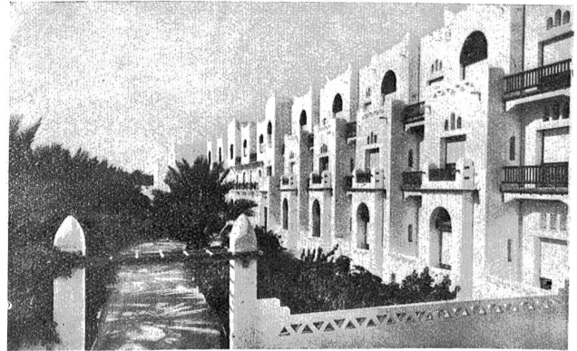
Unser Hotel in Biskra.

ersten Kamele, teils weidend, teils an die Pflüge und Eggen gespannt; überhaupt schien uns das ganze Land mit großer