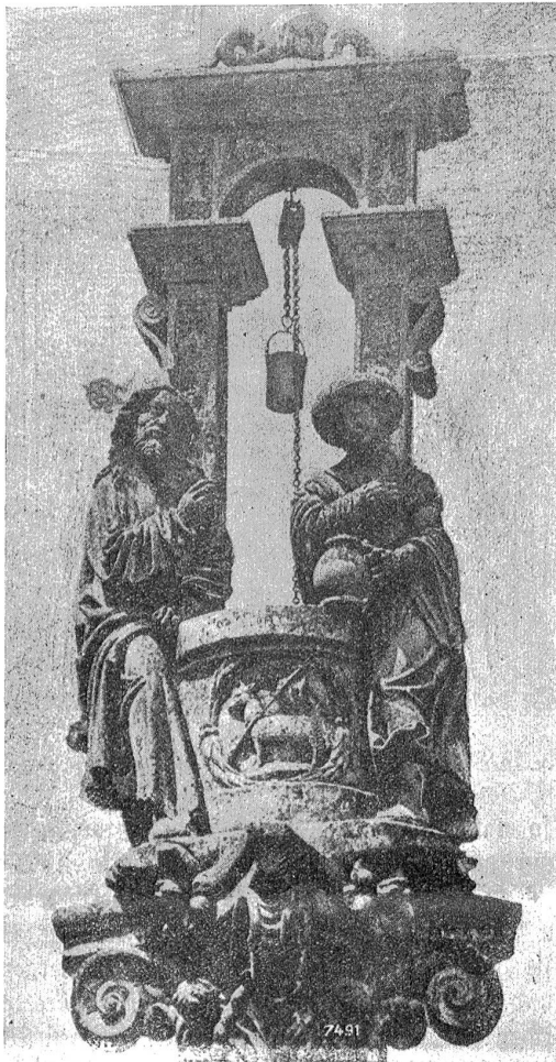
Auffab auf dem Samariterbrunnen in der Au in Sreiburg. Bildhauerarbeit von Hans Gieng (1550).