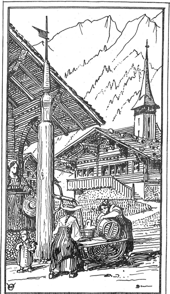
Wohlbrunnen in Meiringen

Neben den genannten fünf Stadtbrunnen müssen im Jahre 1510 noch vier weitere Holzbrunnen bestanden haben,