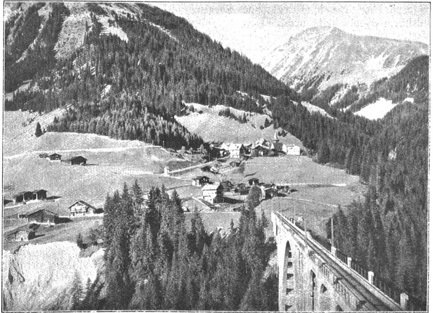
Langwies mit Viadukt.

das Tal und gewährt einen freien Ausblick über saftiggrüne Matten in die einfachen, aber lieblich gelegenen Bergdörferchen des Schanfigg, von denen Tschierschen in besonders beneidenswerter Lage auf einer sonniggrünen Terrasse gebettet ist. Wild zerklüftete Seitentäler, dazwischen wieder tief dunkle Tannenwäldchen, lassen uns immer wieder neue Naturschönheiten entdecken. Brausende Wasserfälle zerstäuben ihre Wässer in Billionen glitzernder und schillernder Perlen. Wie schön und stimmungsvoll sind auch die Stationsgebäude in schlichtem Heimatschutzstil der Umgebung angepaßt. Mit ihren sinnvollen Sprüchen stehen sie vielleicht einzig da, erhalten aber so ein poetisches Cachet, das ganz der romantischen Gegend angepaßt ist. „Es eilt die Zeit, Mensch sei bereit“, „Wo ein Wille, ist auch ein Weg“, diese und andere Lebenswahrheiten werden dir in Erinnerung gerufen. Man könnte fast von einer ambulanten Bergpredigt sprechen. Diese Sprüche zeigen uns aber auch, mit welchem Ernst die Leiter des großangelegten Unternehmens an die Arbeit gegangen sind, wie sie, allen Schwierigkeiten zum Trotz, unermüdet an der Arbeit waren, bis das große Werk vollendet und der erste Zug stolz und siegesbewußt in den Talkessel von Arosa einfahren konnte. Der Spruch „Wo