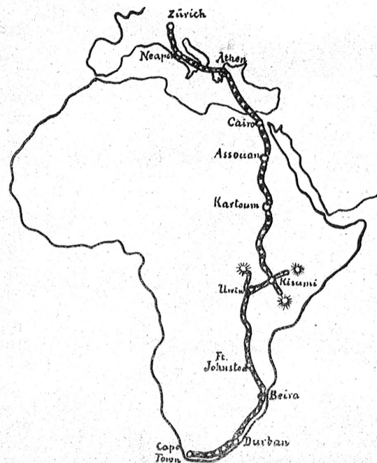
Die Flugroute Mittelholzers.

An photographischen Apparaten ist vorhanden eine Kamera mit Kassette für 120 Platten und automatischem Vor-schub, derart, daß ein Fingerdruck genügt, um den Verschluss zu betätigen, die Platte zu nummerieren und die folgende vor das Objektiv zu bringen. Besonderes Interesse verdient dagegen der nach den speziellen Angaben von Herrn Mittelholzer erstellte Reihenbilderapparat, dessen Objektiv senkrecht abwärts gerichtet ist. Der Apparat selbst ist auf dem Rabinenboden aufgestellt und mit Rollfilm 4×9 Zentimeter geladen. Der Verschluss wird nun durch ein kleines Pro-