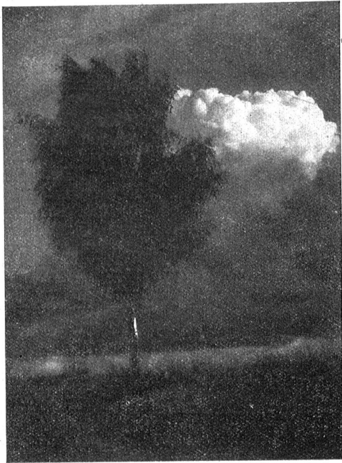
Lehtes Leuchten überm Sommerland.

als ein Galtrind von einem Dezimalbruch. — Und mit den Mädchen, das ist sowieso eine Sorte, die mit jedem neuen Tag eine neue Wunderlichkeit aufs Tapet bringt. Zeig' mir eine allereinzige auf zehn Stunden weit, die heute weiß,