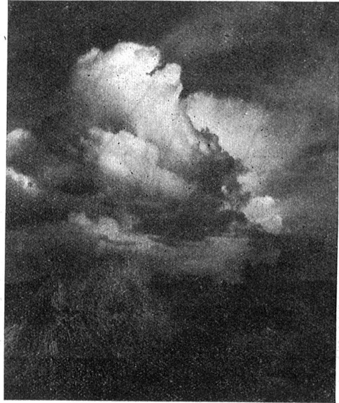
Gewitterstimmung im Erntefeld.

„Jetzt, wenn du so redest, dann geht noch alles zum rechten Loch hinaus“, atmete das schwächliche Bürschlein auf. „Weißt, der Lenzenkonrad und der Tischberger wären mitgekomen. Aber auf den Konradli ist sowieso kein Verlaß, und der Tischberger würde mir am End die Schlappe noch gönnen, weil er selber den Fünfzehntausender einmal scharf im Auge gehabt hat.“