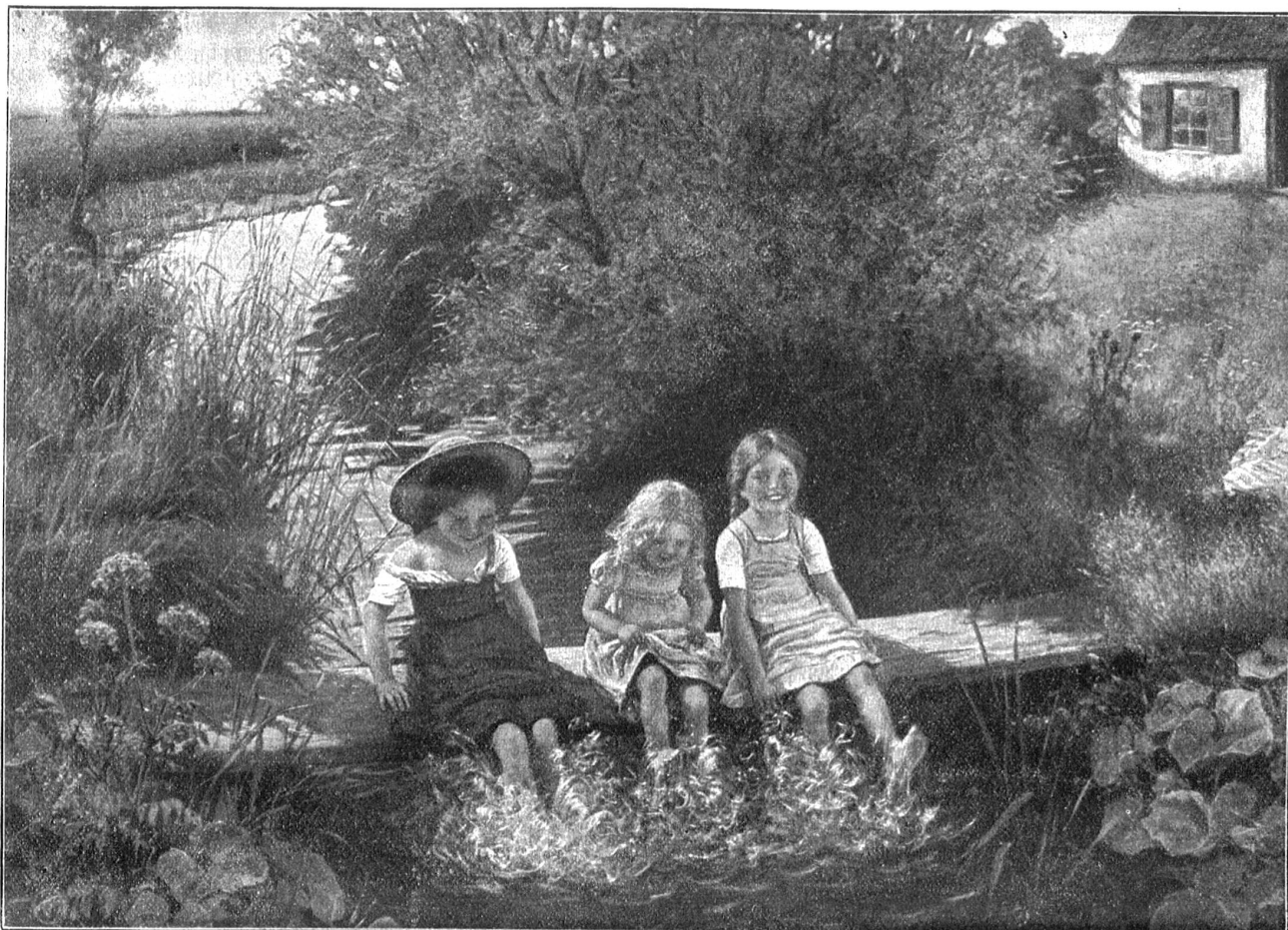
Ein fideles Strandbad.

Vorfrühling mit gleicher Liebe bedacht waren, schienen für ihn nicht da zu sein. „So weiß ist der Baum noch nie gewesen“, sagte er mit leuchtenden Augen.