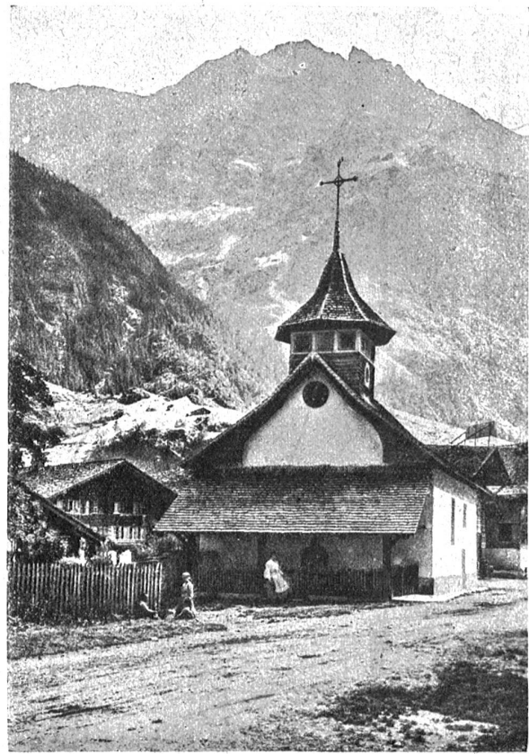
Die Kirche von Guttannen.

Federer in einem seiner prächtigen Romane „Berge und Menschen“ einen unternehmungsträftigen aber zugleich sein Bergvolk liebenden Menschen, den Ernst Broller im Dörflein