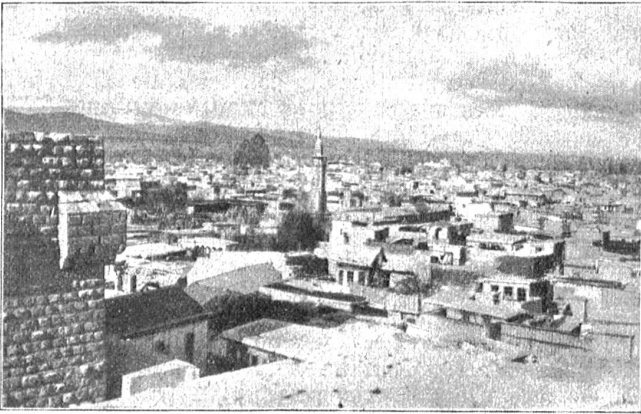
Damaskus, die Hauptstadt Syriens, am Rande der syrischen Wüste, durch die Eisenbahn verbunden mit Beirut und Jaffa an der Küste des mittelländischen Meeres, Ausgangspunkt der Linie nach Mekka.