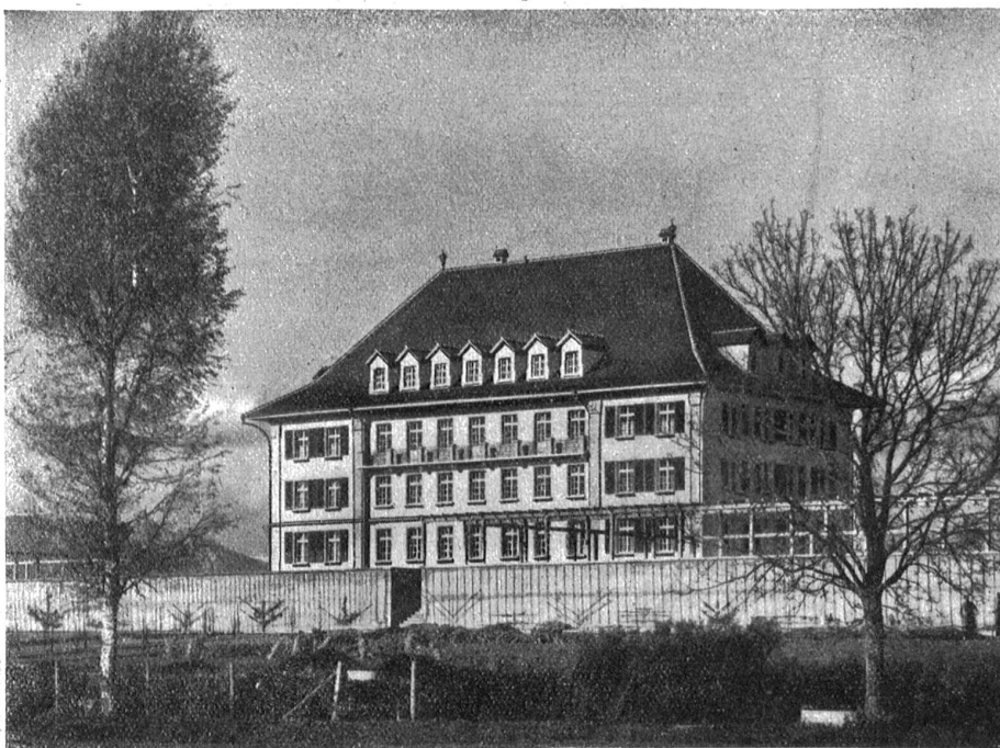
Kantonale Schule für Obst-, Gemüse- und Gartenbau in Döschberg-Koppigen. — Lehr- und Verwaltungsgebäude.

Willkommen Sänger wohlgenut, Willkommen freies Schweizerblut, Laßt eure Weisen schallen