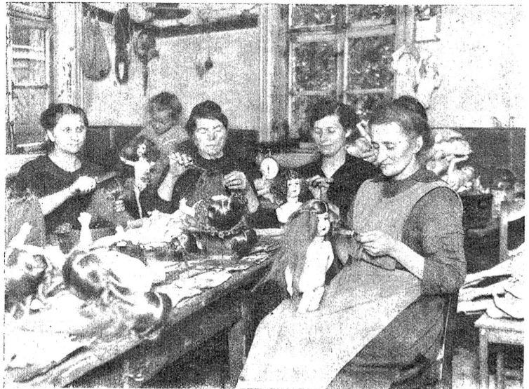
In der Puppen-Strickerstube erhalten die Puppen durch eine entsprechende Striur erst ihr schönes Aussehen.

Eine Bekannte von mir war als kleines Kind einmal in einem Pfarrhaus auf Besuch, wo solch ein Puppenwickelkind aus Urgroßmutter's Zeiten noch in einer Schublade lag. Man holte es hervor und gab es der Kleinen zum Spielen, die voller Entzücken nach der sonderbaren Puppe mit dem wunderlieblichen Porzellangesichtlein griff. „Über,