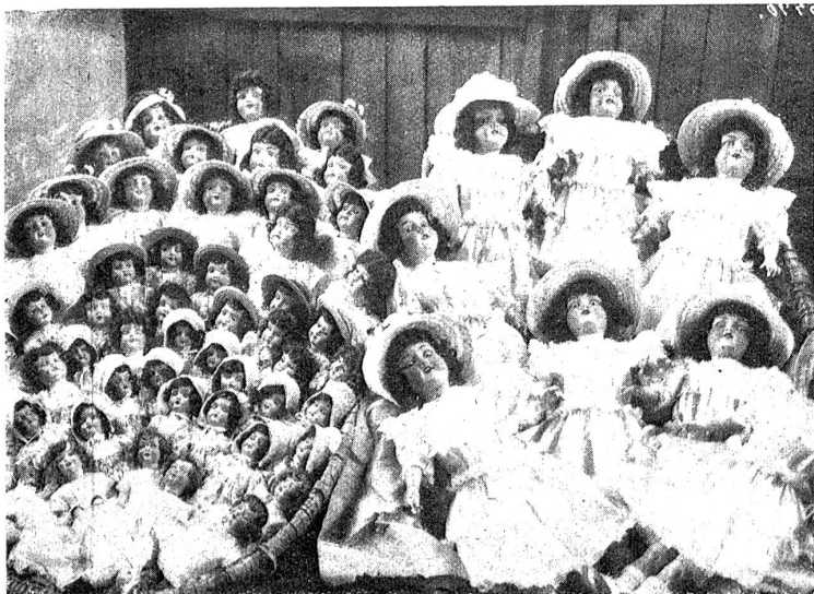
Eine Puppen-Musterkollektion des Weihnachtsmannes.

Puppen überhaupt pflegen; denn dieses „Mutterspielen liegt den Mädchen im Blute, und aus dem Spielen heraus lernt sich der Ernst.“ M. B.