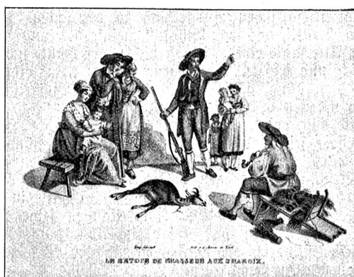
S. R. König, Rückkehr des Gamsjägers.

Mitarbeiter. Die Nötigung zu schnellem und billigem Ar- beiten führte zu einem möglichst einfachen Malverfahren. Die Zeichnung wurde zuerst mit guter chinesischer Tusche