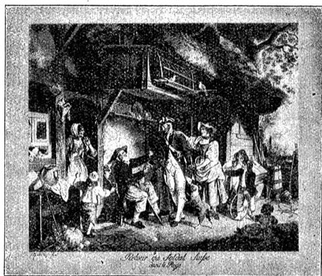
S. Freudenberger, Heimkehr des Soldaten.