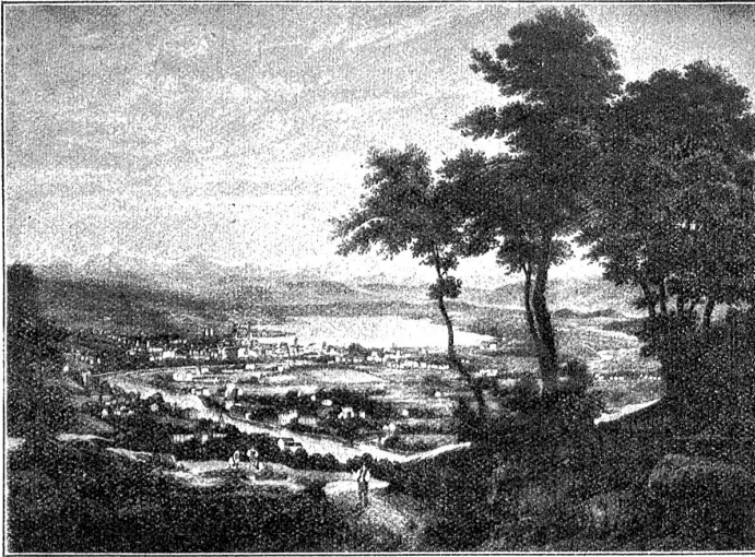
J. Suter, Ansicht von Zürich.