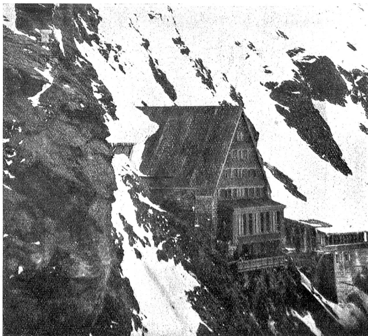
Das Berghaus Jungfrauoch. — Europas höchstgelegenes Hotel. — 3457 Meter über Meer.

brochen. Aber nach stündiger Fahrt bin ich oben auf der lichten Höhe des Soches. Und siehe da, der Nebel und die lastenden Wolken, die unten alles in ihre grauen Arme lautlos eingeschlossen haben, hier oben war ihre Macht gebrochen. Wohl jagten dann und wann zuende Windstöße vereinzelt Nebelfetzen über die Höhe, doch dann lag die märchenhafte Bergwelt in ihrer totenstillen Vereinsamung offen vor mir. Ganz im Süden grüßten über den Wolken die Gipfel der Lepontinischen Alpen, selbst das stolze Eggishorn leuchtete im strahlenden Gipselschnee freudig auf, majestätisch aber bildeten Kamm, Dreieckhorn und Kranzberg die Wache über den Melsch, der in seiner Neuschneedecke blendendes Licht aus-