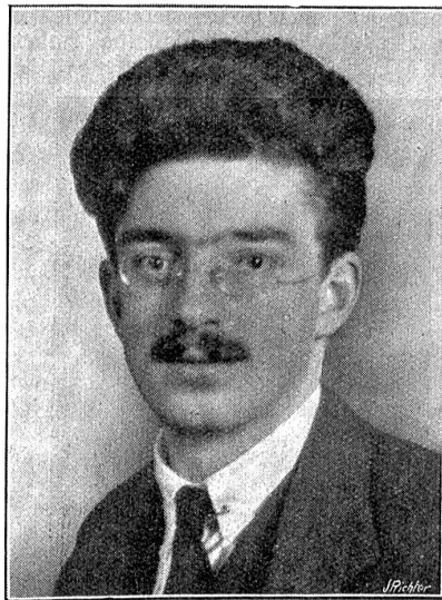
Plinio Bolla, der neue Bundesrichter.

war. Auf diese Weise würden jährlich etwa 5000 Auslandsschweizerkinder zu Schweizerbürgern. Ein Vorbehalt, daß dem dem betreffenden „Muschweizer“ die Möglichkeit gegeben werden müsse, sich späterhin nach eigenem Gutfinden