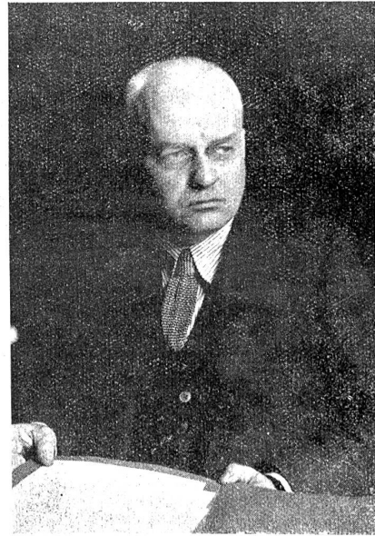
Dr. Luther, der neue deutsche Reichskanzler.

erscheinung, als eine bloße Etappe in der chronisch gewordenen Regierungskrise. Die Rheinlande fürchten trotz gegenteiliger Erklärung eine Gefährdung des Dawes-Planes,