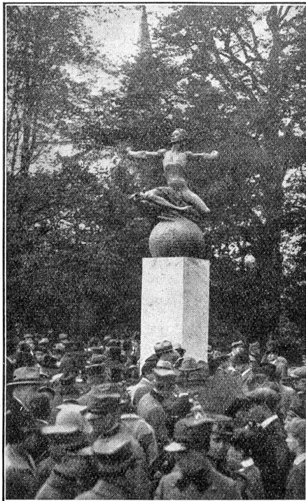
Das Bider-Denkmal auf der Kleinen Schanze in Bern.

Am letzten Samstag ist in der Bundesstadt das Bider-Denkmal feierlich ein-