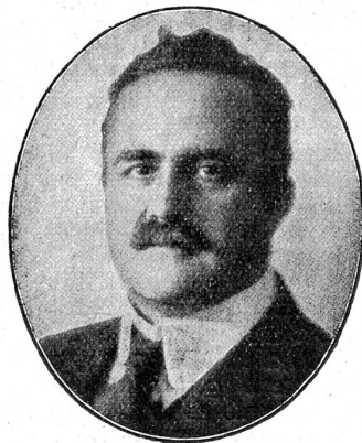
Professor Dr. Max Huber,

Der Ständerat diskutierte viel über das Gesetz für Jagd und Vogelschutz, das auch erledigt wurde und auch über das Zollgesetz. Bei letzterem mußten der Kommission eine ganze Reihe von Artikeln nochmals zur Prüfung übergeben werden, da besonders der deutsche Text äußerst mangelhaft war. Zum Schlusse wurden noch einige Petitionen behandelt und Arbeitslosenfürsorge- und Versicherung in Zustimmung zum Nationalrate erledigt. Hierauf vertrugen sich beide Räte bis zur am 1. Dezember beginnenden Wintersession.