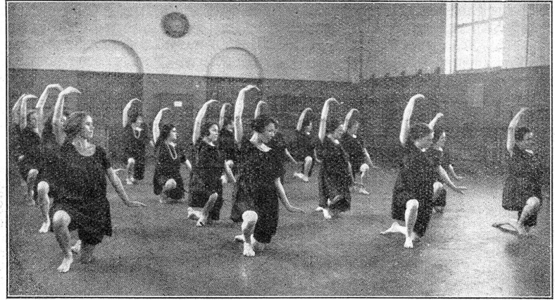
Momentbild aus einem rythmischen Freiübungsreigen der Damenriege des Turnvereins Länggasse Bern.