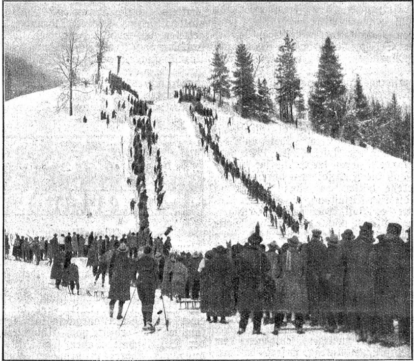
XVII. schweizerisches Skirennen in Grindelwald.

Die nationalrätliche Zolltarifkommission beschloß mit allen gegen drei Stim-