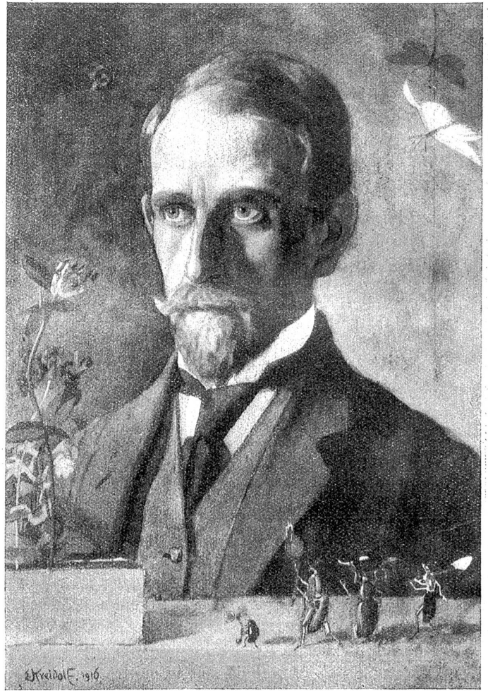
Ernst Kreidolf : Selbstbildnis.

Charlotte seufzte. „Ich weiß eben nicht, was ich wünschen soll. Wenn ich ein Mann wäre, so wüßte ich es. Ich würde in einer großen Stadt studieren, Geschichte oder Biologie oder Nationalökonomie, irgend eine Materie, die von einer Seite dem Menschen und der Menschheit beikommt; nebenbei ginge ich so viel als möglich aus, in die politischen Räte und Versammlungen, in die Armenquartiere und Zufluchts Häuser, in Theater und Lokale, wo die Großstadtgesellschaft hingehet — ich hätte reichlich ein paar Jahre zu tun, und nachher wüßte ich wahrscheinlich, wo ich mich hinstellen oder ob ich weiter lernen und sehen sollte. Vielleicht würde ich mir eine Familie gründen; vielleicht würde ich die Freiheit vorziehen, um einem Herzensberuf zu leben. Möglicherweise könnte ich diesen Plan auch als Mädchen ausführen, aber nur in sehr beschränkter Weise; und darüber eben hoffte ich, Sie befragen zu dürfen. Ich werde ja einen Bruch zu Hause riskieren müssen, und das ist