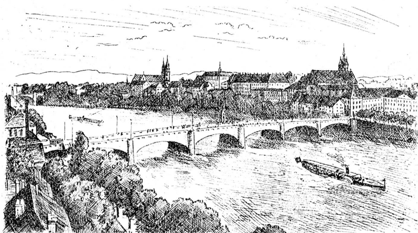
Die mittlere Rheinbrücke mit Münster und Martinskirche.

„Wer?“ schallt es zurück. Ich wiederhole möglichst in der Aussprache und im Tonfall Kathrinens: