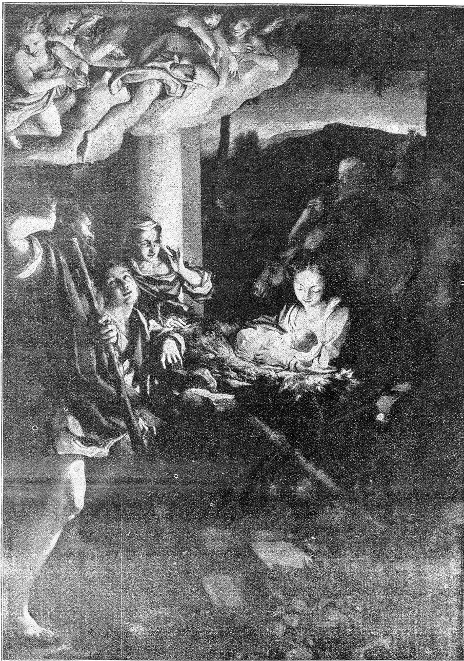
Correggio: Die Geburt Christi, genannt „Die Nacht“.

Während des Lesens überzieht ihr Gesicht eine tiefe Enttäuschung. Erblichend lehnt sie sich weit zurück auf den