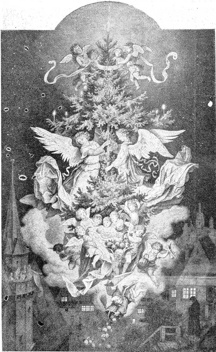
Ludwig Richter: In der Christnacht. Radierung.

die mich so elend und unfähig macht, die mich hungernd, verächtlich vor den Toren stehen läßt, die mir Einlaß geben sollten. Ich muß doch Geld haben! Dir soll nichts mangeln! Es kommt der Erste, der Zahltag! — Ja, wenn sich aus Herzblut Geld prägen ließe! Dann, Kindchen, dann!”