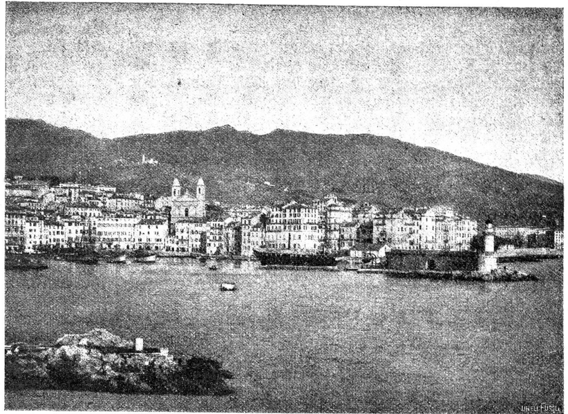
Bastia, Hafenstadt an der Nordküste Korsikas.

Von der Paghöhe zogen wir nordwärts zum Grat des capcorsischen Bergzuges hin und stiegen zum etwa 1000 Meter hohen Pigno hinauf. Der wenig unterhaltene Fußpfad führte durch niedriges Gesträuch, bestehend aus wohlriechenden Erikabäumen, Myrten, Ginster, Thymian. Wacholder, Erdbeerbäumen (arbusier) und dergl. Es ist bekannt unter dem Namen Macchia, franz. mâquis, „immergrüner Buschwald“ (nach Riffi) und bedeckt mehr als die Hälfte des korsischen Bodens, was der Insel vor allem das seltsame Aussehen gibt. Unendlich viel Mühe braucht es, die nur Bienenhonig, Wurzelholz und magere Ziegenweide bietende Macchia auszureuten und an ihre Stelle auf dem karglichen Erdreich Felser und Fruchtgärten anzulegen. Seit ältesten Zeiten scheint der Korse an dieser Beschäftigung keine besondere Freude gehabt zu haben, und daß er sie etwa jetzt bekomme, ist wenig wahrscheinlich; wäre doch der hieraus resultierende Lohn namentlich heutzutage gar zu karg, während die durch den Militärdienst sowieso geförderte Auswanderung nach dem französischen Festland und besonders nach den Kolonien Algier und Tu-