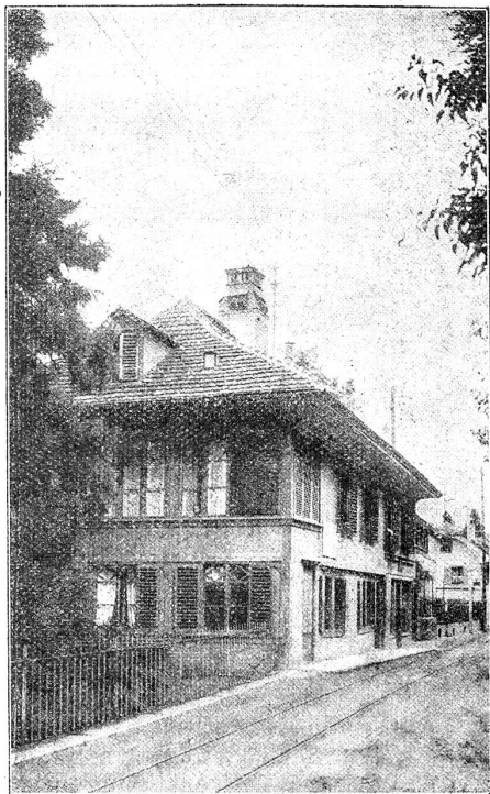
Johannes Brahms Wohnhaus in Thun.

Orchestervereins Thun und des Berner Stadtorchesters mehrere Werke des Meisters zur Aufführung bringen. Wir möchten nicht verfehlen, unsere Leser auf den genussverspre-