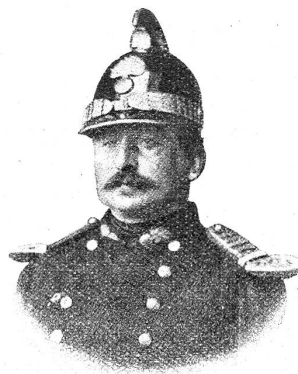
Brandkorpschef Bomonti (1863—1875).