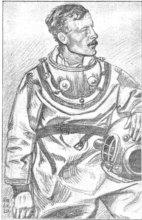
Ein Taucher.