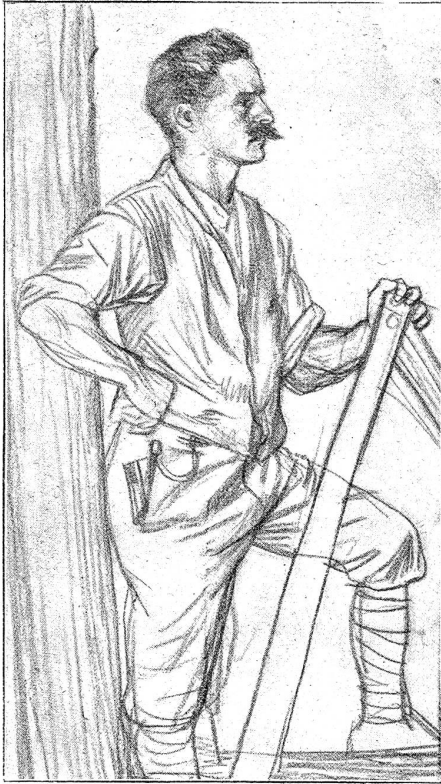
Ein Zimmermann-Vorarbeiter. (Aus „Von großer Arbeit“. Verlag A. Franke, Bern.)

einer Kahnfahrt den „Wohlensee“ hinunter, zum Erlebnis geworden ist. Er gewinnt sich damit gleichzeitig das neueste