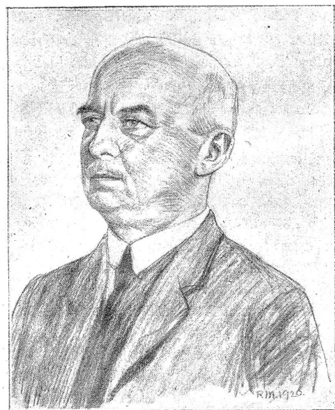
Oberster Bauleiter und Projekt-Verfasser. (Aus „Von großer Arbeit“. Verlag A. Francke, Bern.)

Ob solchen Gesprächen der handelnden Personen geht aber der Zusammenhang mit dem Bauwerk keineswegs verloren. Läubli, der Monteur, findet im Bauernhaus Unter-